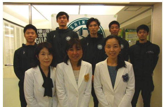
西宮ストークスの選手とアスリートフードマイスター

1ヶ月に10戦前後の試合をこなす選手たちのために、スポーツ栄養学についてのアスリートフードセミナー開催をはじめ、選手や指導者よりヒアリングを行い、目的（タイミング・トレーニング・ボディコンディション等）に沿ったフードカルテの提供、選手個別の食事アセスメント・フードコーチング、その他、メニューからチームが希望する食事指導サポート等を実施します。