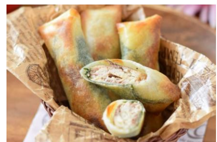
オイルサーディンの大葉チーズ春巻き

レシピページには、アスリートフードマイスターによるベスト・コンディションづくりのためのレシピなどがバリエーション豊かに並び、見た目にも食欲をそそるメニューが日々投稿されています。アスリートページではトップマラソンランナーの大迫傑選手や、プロ車いすテニスプレイヤーの国枝慎吾選手の食事情を特集したコラムを掲載。学生トップアスリートたちの座談会も注目の記事となっています。